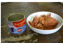
←トナカイ肉の缶詰（フィンランド産）