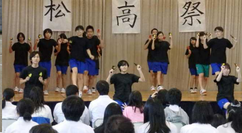
《松高祭ステージ発表》