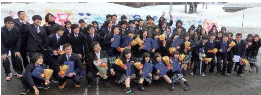
《卒業式後の記念撮影》

入学したばかりの頃は、新しい環境で生活することへの不安も多くありましたが、先生方や先輩方のおかげで早く学校に慣れることができました。様々な活動を通していろいろな経験をすることができ、今はとても充実した学校生活を送っています。松之山分校に入学して本当に良かったと感じています。