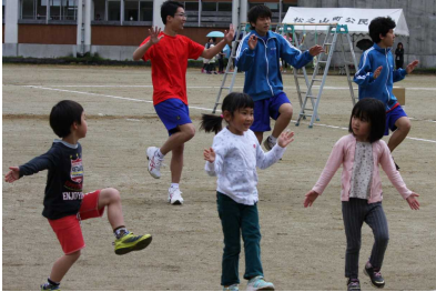
《体育祭 保育園児とダンス》

体育祭、松高祭（文化祭）、球技大会など、すべての生徒に活躍の場があり、まさに「一人一人の生徒が主役」になれるのが大きな特色です。