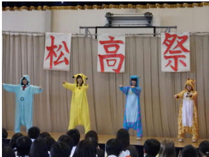
《松高祭かくし芸大会》