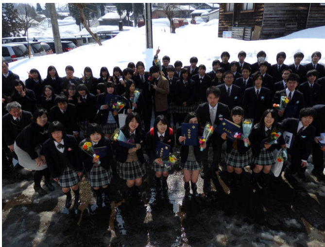
《卒業式後の記念撮影》

入学したばかりの頃は、学習面や学校生活、人間関係など不安なことがたくさんありましたが、先生や先輩方と楽しく気軽に話す機会が多く、学校が楽しくなり、とても充実した学校生活をおくっています。松之山分校に入学して本当に良かったと感じています。