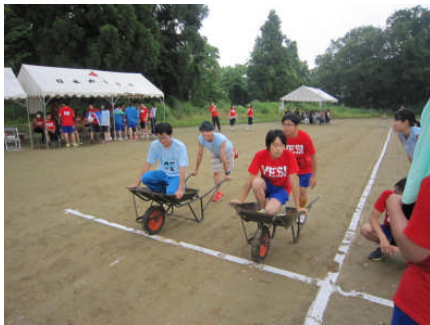
《体育祭 障害物競走》