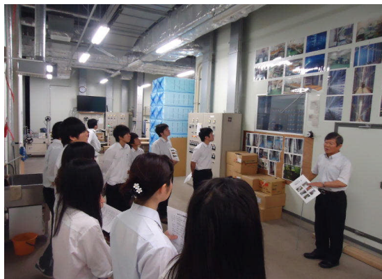
《3年生地元企業訪問》