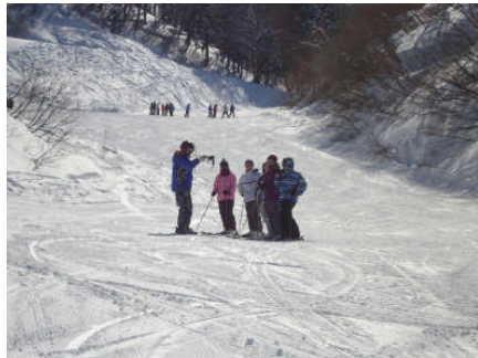
《1・2年生スキー授業》