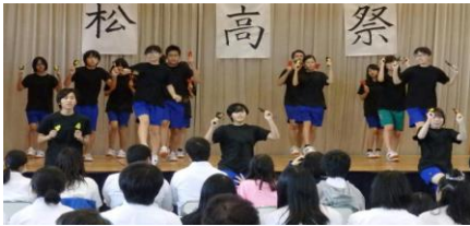
《松高祭ステージ発表》

体育祭、松高祭（文化祭）、球技大会などすべての生徒に活躍の場があり、まさに「一人ひとりの生徒が主役」になれるのが大きな特色です。