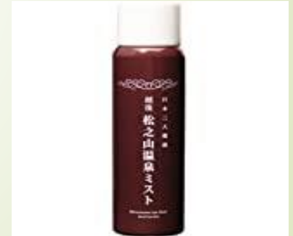
松之山温泉ミスト